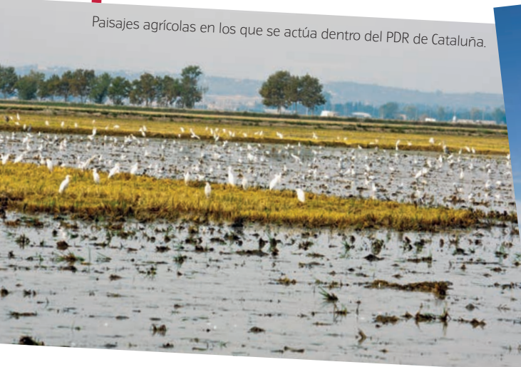
Paisajes agrícolas en los que se actúa dentro del PDR de Cataluña.

Todo se hace a través de una programación muy estratégica que cubre el 88 por ciento de la superficie total de Cataluña y el 79 por ciento del total de municipios, y que afecta al 34 por ciento de la población. Toda estrategia parece poca ante el gran reto que se nos plantea, que no es otro sino el fortalecimiento y empoderamiento del mundo rural, entendiendo que la vida diaria y la actividad que allí se genere tendrán una enorme repercusión más allá de los estrictos valores productivos de las explotaciones. Vida que va desde la evidente configuración de nuestros paisajes a aspectos que, no por ser intangibles o no apreciables a simple vista, tienen menor importancia, como son la salud natural, social y cultural del conjunto de nuestro territorio