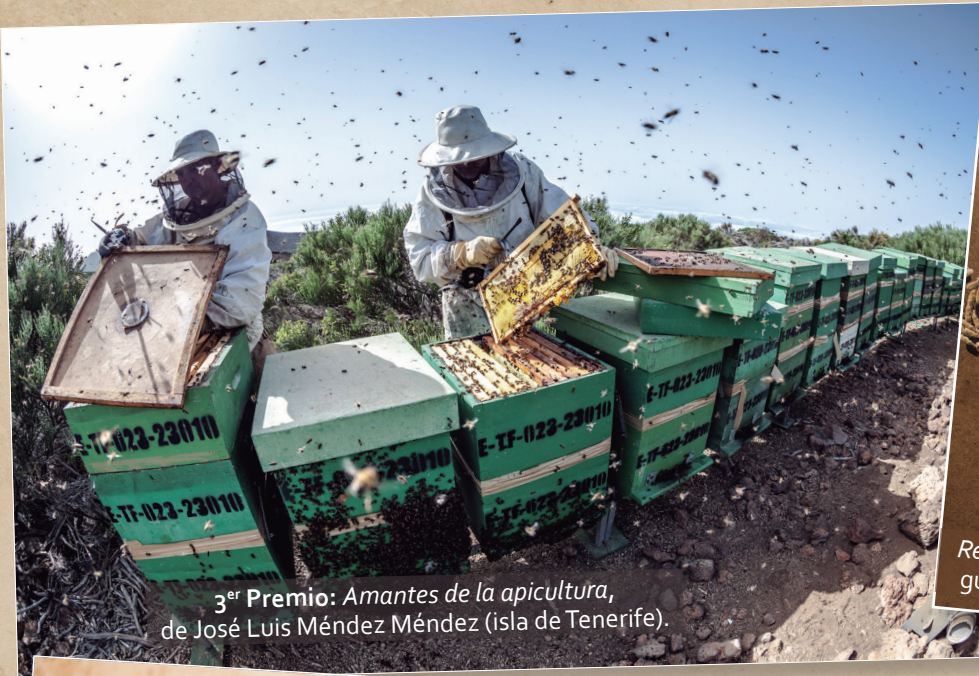
3 er Premio: Amantes de la apicultura , de José Luis Méndez Méndez (isla de Tenerife).