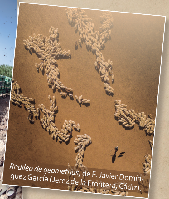
Redileo de geometrías , de F. Javier Domínguez García (Jerez de la Frontera, Cádiz).