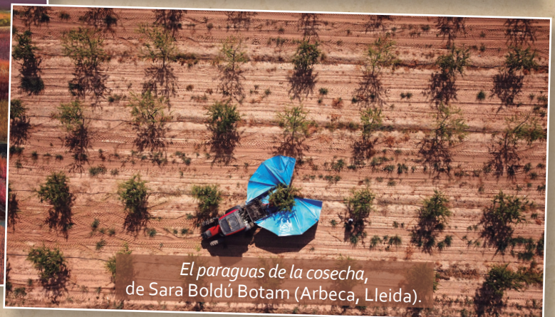
El paraguas de la cosecha , de Sara Boldú Botam (Arbeca, Lleida).