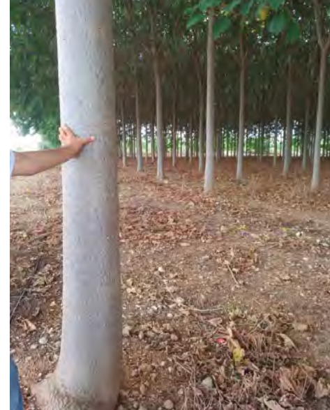
Algunos de los proyectos auxiliados: gestión del ganado ovino, cultivo y aprovechamiento de Paulonia y sistema de comercialización vertical Farmers & Co, (Premio Nacional de Comercio Interior 2017).