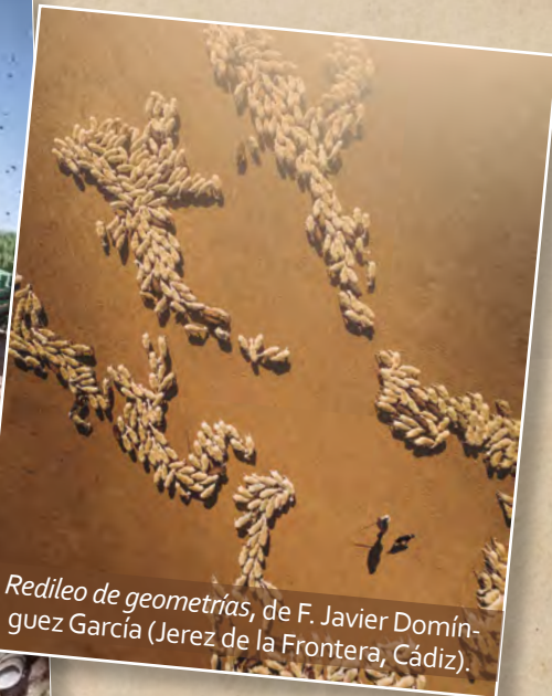
Redileo de geometrías , de F. Javier Domínguez García (Jerez de la Frontera, Cádiz).