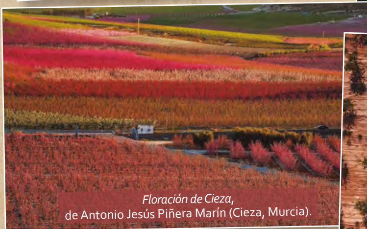
Floración de Cieza , de Antonio Jesús Piñera Marín (Cieza, Murcia).