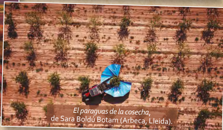
El paraguas de la cosecha , de Sara Boldú Botam (Arbeca, Lleida).