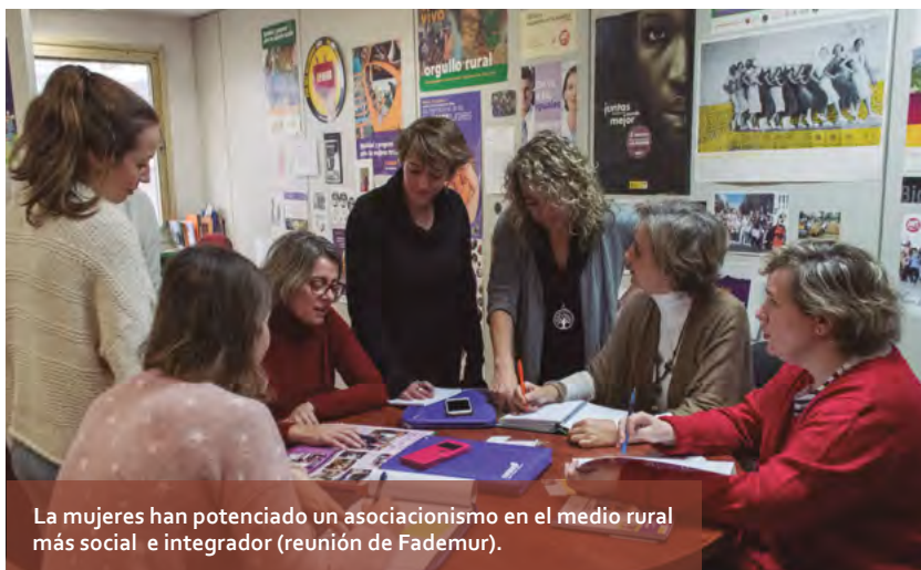
La mujeres han potenciado un asociacionismo en el medio rural más social e integrador (reunión de Fademur).