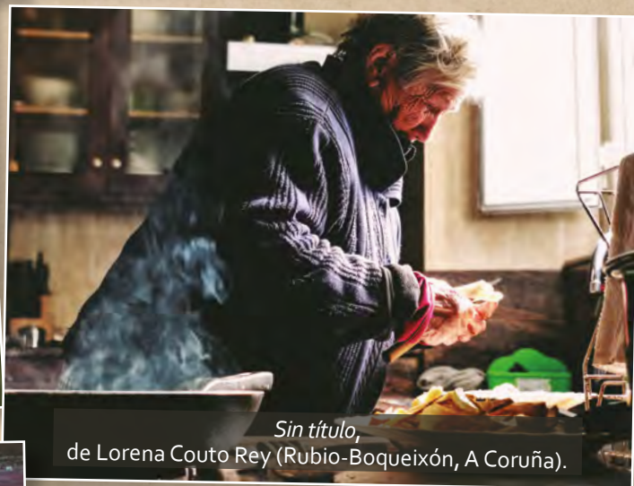
Sin título , de Lorena Couto Rey (Rubio-Boqueixón, A Coruña).