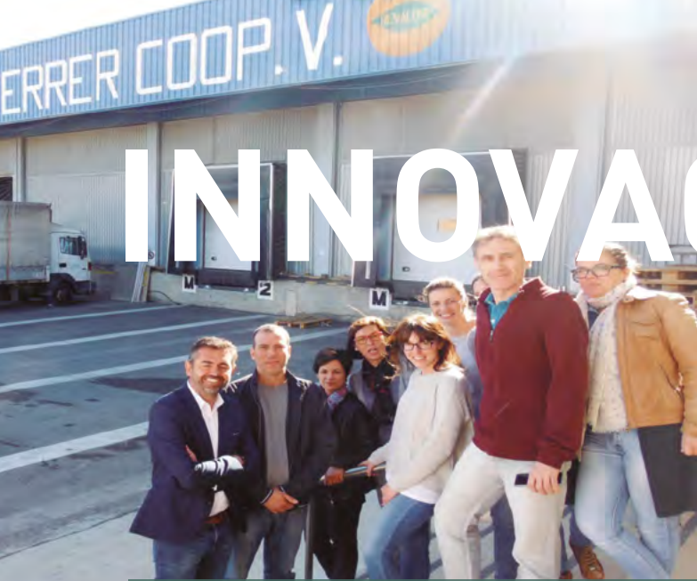
Personas participantes en el grupo operativo Innoland delante de la cooperativa que lo impulsa y en una de sus reuniones; e imágenes de las tierras en las que actúan en Benaguasil (Valencia).