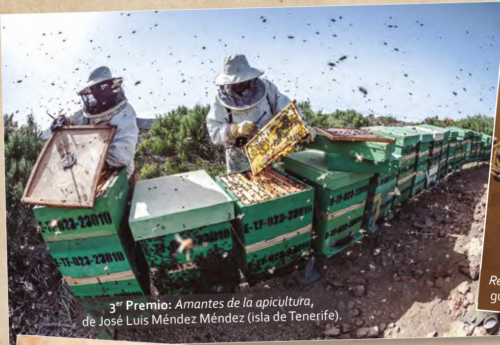
3 er Premio: Amantes de la apicultura , de José Luis Méndez Méndez (isla de Tenerife).