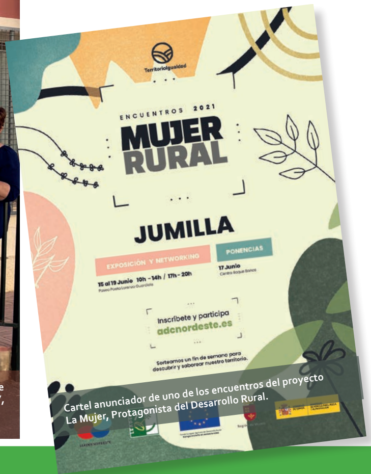
Cartel anunciador de uno de los encuentros del proyecto La Mujer, Protagonista del Desarrollo Rural.