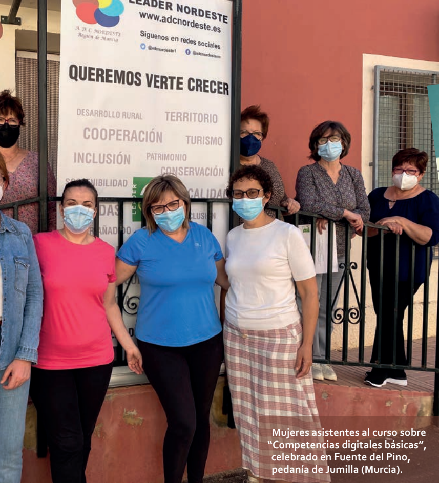
Mujeres asistentes al curso sobre "Competencias digitales básicas", celebrado en Fuente del Pino, pedanía de Jumilla (Murcia).