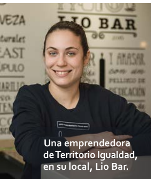
Una emprendedora de Territorio Igualdad, en su local, Lio Bar.