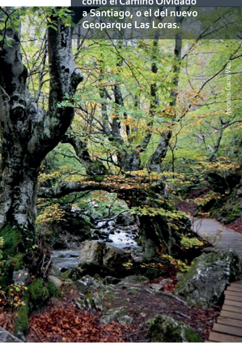
Asociación Caminos Vivos

La valorización del patrimonio natural y cultural es un objetivo común de algunos proyectos, como el Camino Olvidado a Santiago, o el del nuevo Geoparque Las Loras.