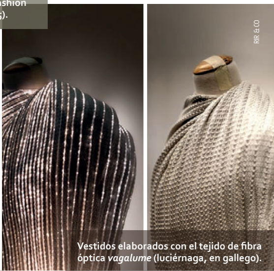
RIR & CO