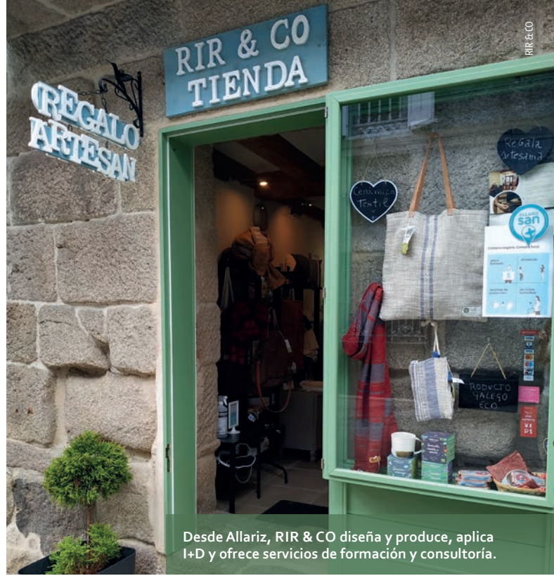
RIR & CO

Desde Allariz, RIR & CO diseña y produce, aplica I+D y ofrece servicios de formación y consultoría.