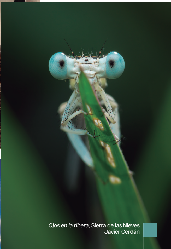
Ojos en la ribera, Sierra de las Nieves Javier Cerdán