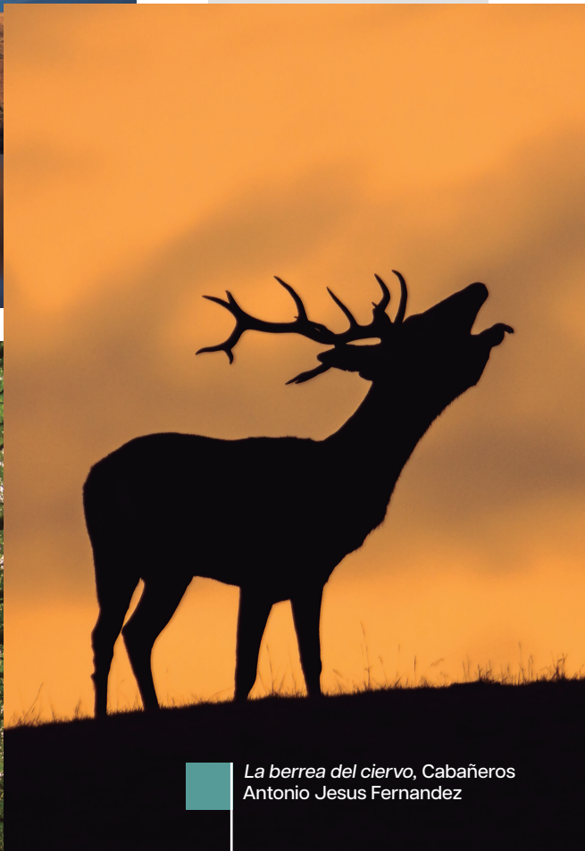
La berrea del ciervo, Cabañeros Antonio Jesus Fernandez