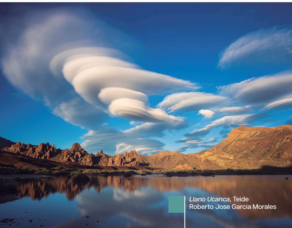
Llano Ucanca, Teide