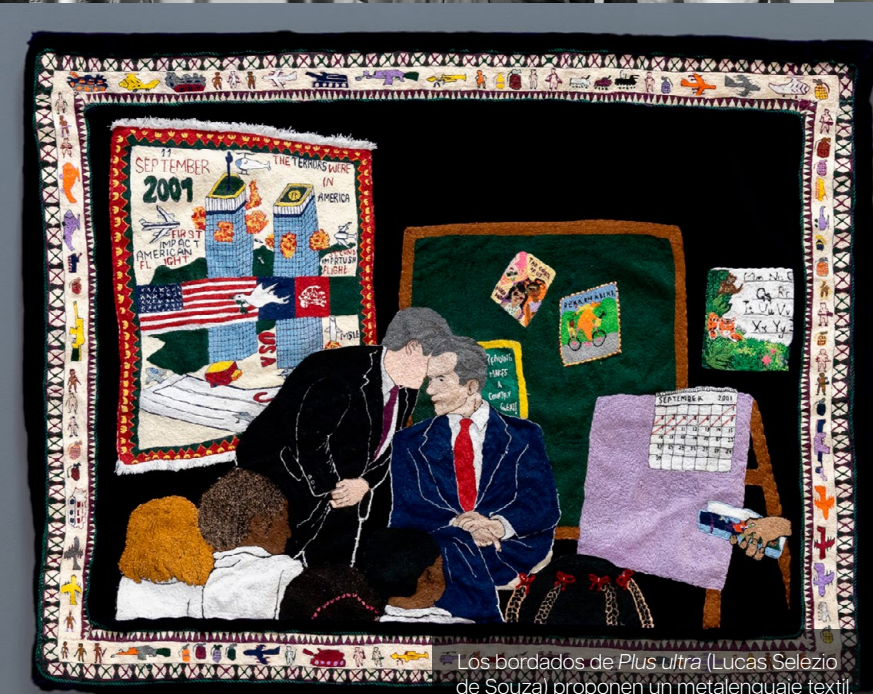
Los bordados de Plus Ultra (Lucas Selezio de Souza) proponen un metalenguaje textil.