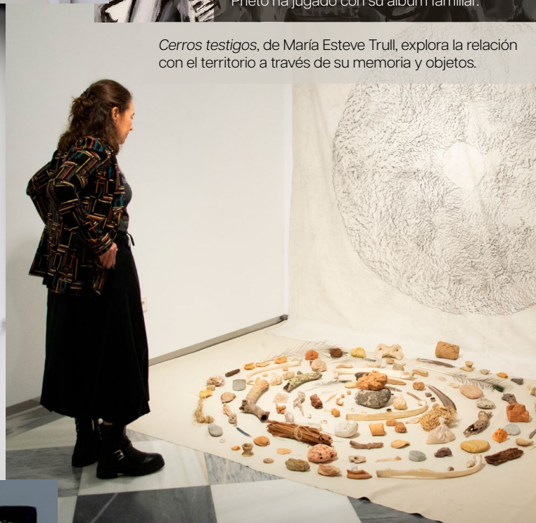
Cerros testigos , de María Esteve Trull, explora la relación con el territorio a través de su memoria y objetos.