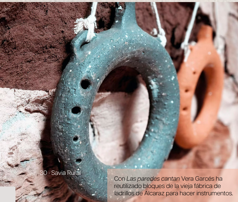
30 · Savia Rural