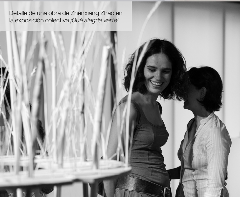
Detalle de una obra de Zhenxiang Zhao en la exposición colectiva ¡Qué alegría verte!