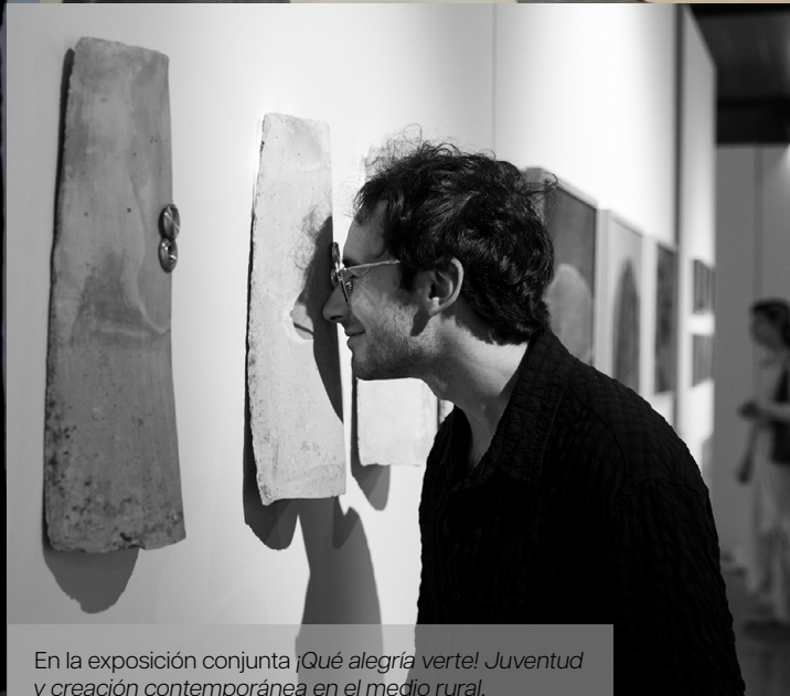
En la exposición conjunta ¡Qué alegría verte! Juventud y creación contemporánea en el medio rural .