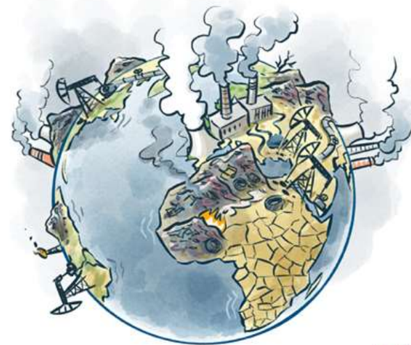
FOSSIL - BASED ECONOMY

Europa se afianzará como un socio global fiable y exportador referencia de bio-soluciones sostenibles