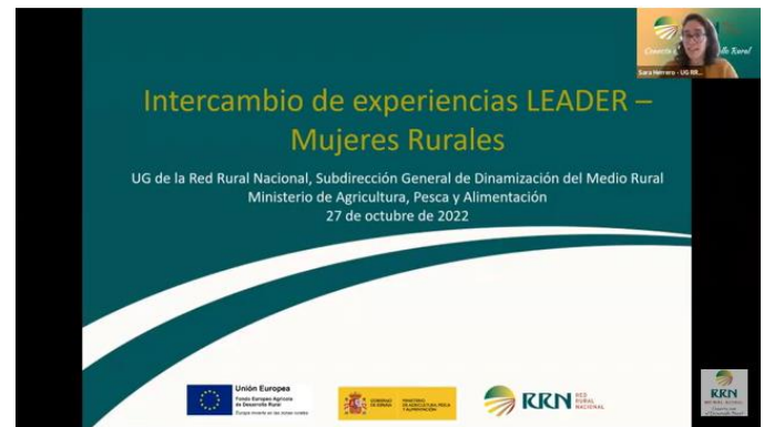
Foto 2: Presentación de las acciones de la RRN por parte de Sara Josefa Herrero. Unidad de Gestión de la RRN (MAPA).

acciones llevadas a cabo por la RRN en materia de mujeres en los últimos meses.