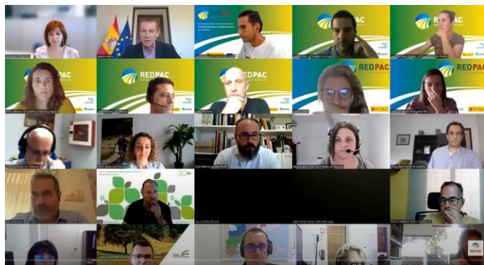
Foto 2: Representación de una parte de los asistentes a la jornada.