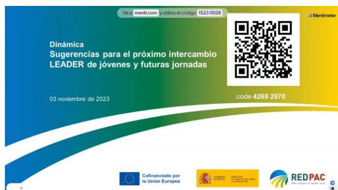
Foto 8: Diapositiva presentada para obtener propuestas sobre el próximo intercambio LEADER de Jóvenes