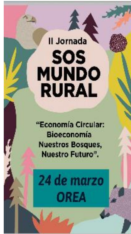
Nuestros Bosques Nuestro Futuro 2018