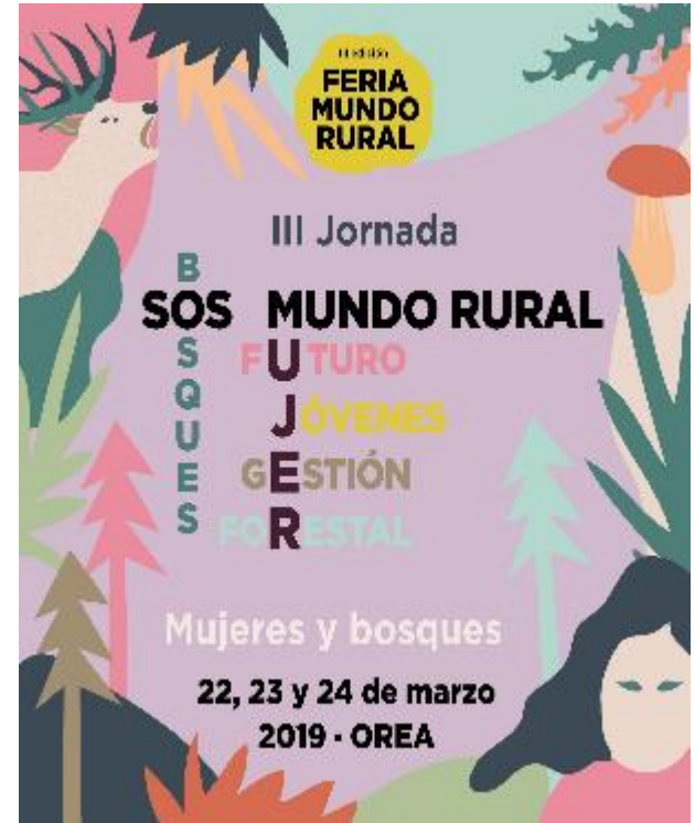
Mujeres y Bosques 2019