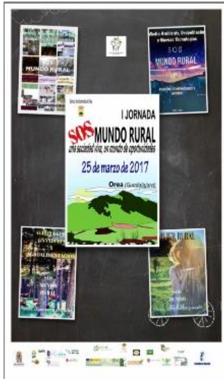
Mundo Rural, Un mundo de Oportunidades 2017