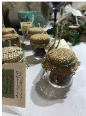
Aditives to drinks