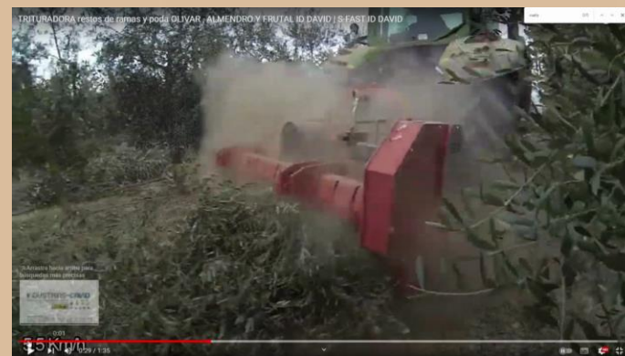
Vegetales (ID vídeo)