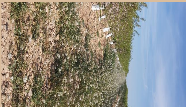
Espontánea (Pedro Sopena, Huesca)