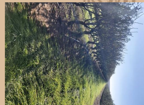
Sembrada (Finca San Antonio, Talavera)