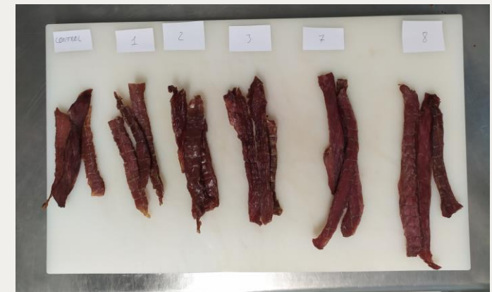
Proceso y formulación