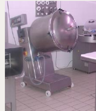
Bombo de maceración