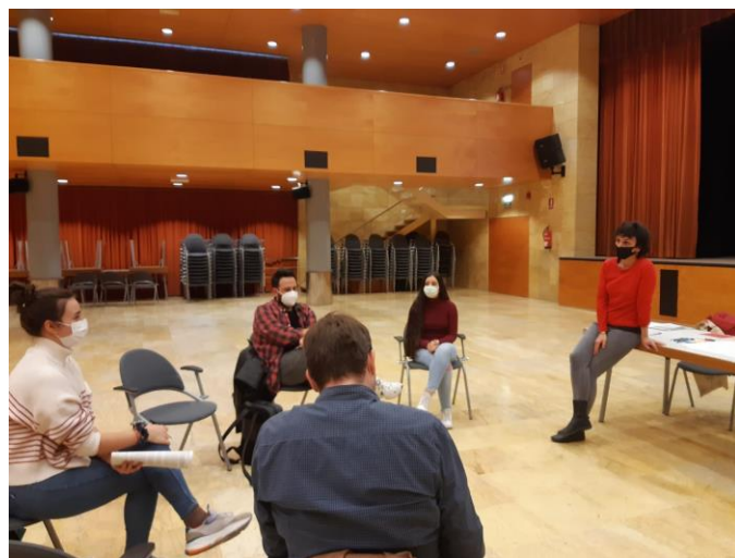
Foto 2. Presentación de las entidades.

A continuación, tuvo lugar una dinámica rompehielos en la que los asistentes se conocieron entre ellos de una manera informal.