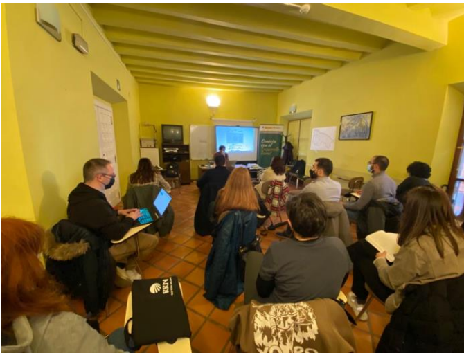
Foto 1: Inauguración y presentación inicial por parte de la Antena Regional de La Rioja de la Red Rural Nacional y los responsables del proyecto G30 Jóvenes del Gobierno de La Rioja.

Esta jornada presencial fue la decimoctava de una serie de 25 encuentros y se celebró en la Casa de Cultura de Arnedo .