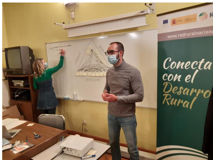
Foto 3: Sociograma. En una fase inicial, se indican las relaciones actuales entre las asociaciones y otras entidades que participan en la jornada.

El sociograma se elaboró de manera conjunta y colaborativa. Esta dinámica reflejó una situación actual en la que las relaciones eran más frecuentes y sólidas entre las entidades de la administración. En cambio, las relaciones entre asociaciones de jóvenes y/o jóvenes a título personal eran menos habituales, así como las relaciones entre jóvenes y entidades de la administración. No obstante, hay que tener en cuenta que la proporción de asistentes en cuanto a asociaciones y/o grupos de jóvenes fue menor de la esperada. De ahí que se planteó la necesidad de seguir trabajando en la búsqueda de canales de comunicación que tengan en cuenta las motivaciones más frecuentes y actuales de los jóvenes, especialmente con los del medio rural.