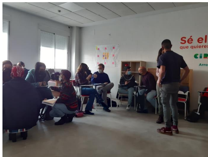
Foto 2. Dinámica de rompehielos

A continuación, tuvo lugar una dinámica rompehielos en la que los asistentes se conocieron entre ellos de una manera informal.