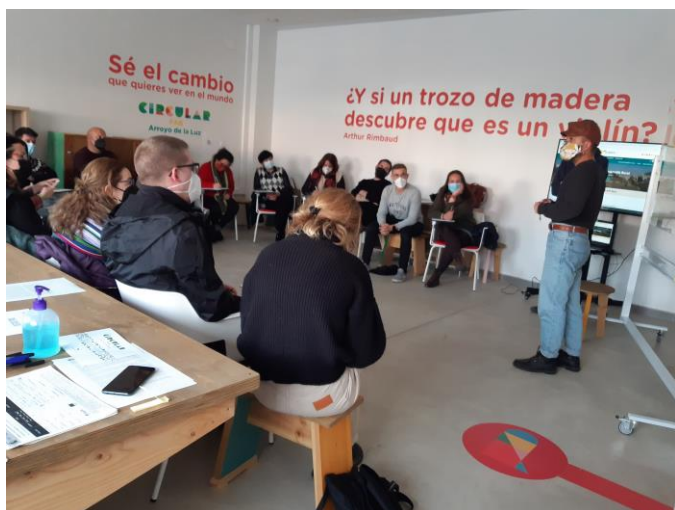
Foto 3. Presentación de las asociaciones y entidades presentes

Tras esta presentación se hizo un descanso para la visita del centro y a continuación, se desarrolló la dinámica del sociograma a través de la cual se pretendía conocer de manera gráfica el grado de relación entre los asistentes y, en un siguiente paso, entre las entidades relevantes en materia de juventud en general.