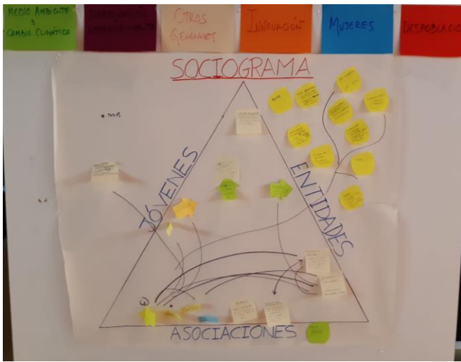
Foto 3: Sociograma. Relaciones existentes entre las asociaciones, entidades y jóvenes

También quedó patente que faltaban muchas asociaciones y entidades que eran relevantes en materia de juventud sin representación en el evento.