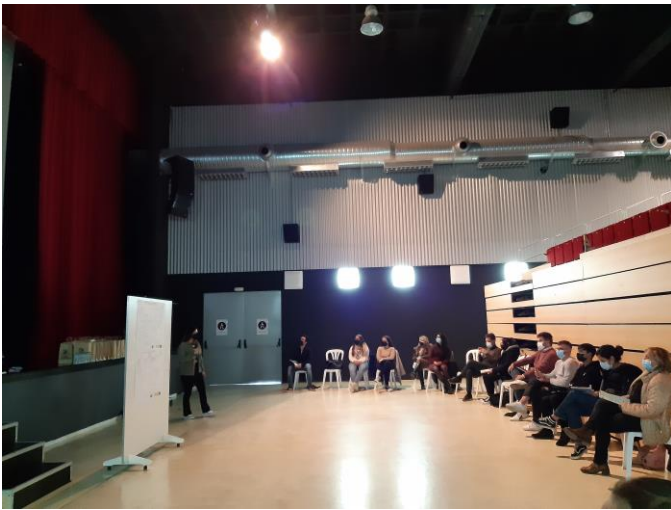
Foto 2. Presentación de las asociaciones y entidades presentes

Tras esta presentación se hizo un descanso y a continuación, se desarrolló la dinámica del sociograma a través de la cual se pretendía conocer de manera gráfica el grado de relación entre los asistentes y, en un siguiente paso, entre las entidades relevantes en materia de juventud en general.