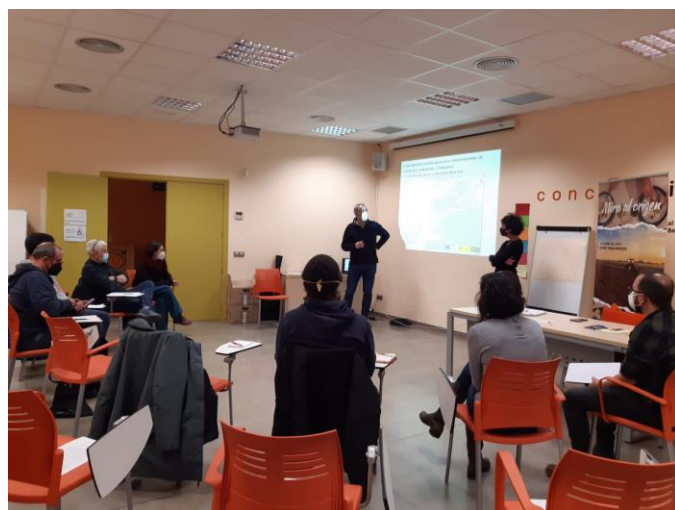
Foto 2. Presentación de las entidades.

A continuación, tuvo lugar una dinámica rompehielos en la que los asistentes se conocieron entre ellos de una manera informal.