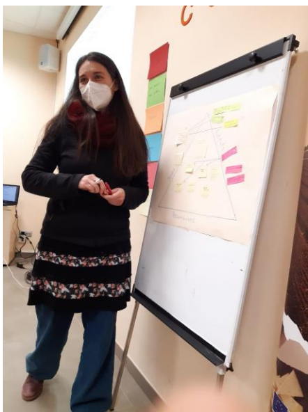
Foto 3: Asistente de la jornada durante la elaboración del sociograma

Tras esta presentación se hizo un descanso y a continuación, se desarrolló la dinámica del sociograma a través de la cual se pretendía conocer de manera gráfica el grado de relación entre los asistentes y, en un siguiente paso, entre las entidades relevantes en materia de juventud en general.