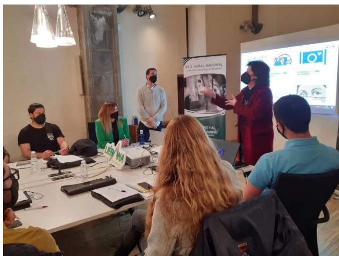
Foto 2. Presentación de las entidades.

Tras esta presentación se hizo un descanso y a continuación, se desarrolló la dinámica del sociograma a través de la cual se pretendía conocer de manera gráfica el grado de relación entre los asistentes y, en un siguiente paso, entre las entidades relevantes en materia de juventud en general.