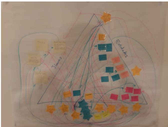
Foto 3. Resultado del sociograma

Las personas jóvenes que asistieron a título individual al evento señalaron que para que estos encuentros tengan un mayor impacto en la población más joven es necesario adaptar el mensaje a transmitir y utilizar la red social adecuada en función del rango de edad.