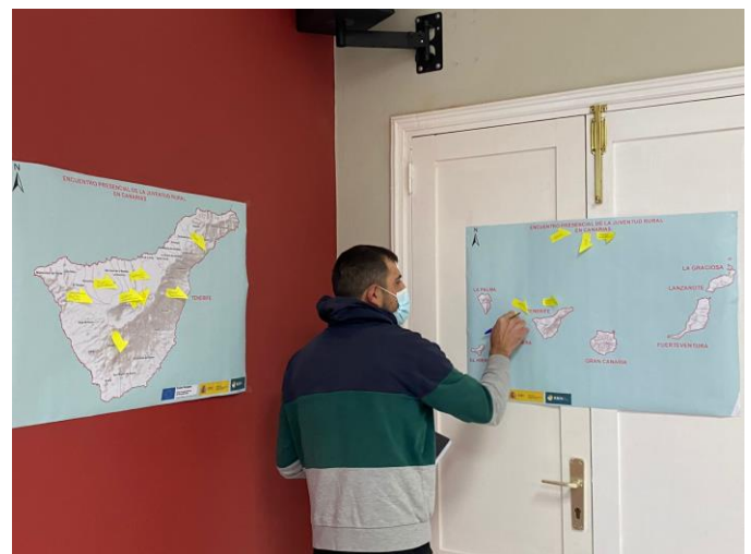
Foto 2. Colocación de las distintas asociaciones y entidades en un mapa para poder establecer relaciones según su cercanía.

A continuación, tuvo lugar una dinámica rompehielos en la que los asistentes se conocieron entre ellos de una manera informal.