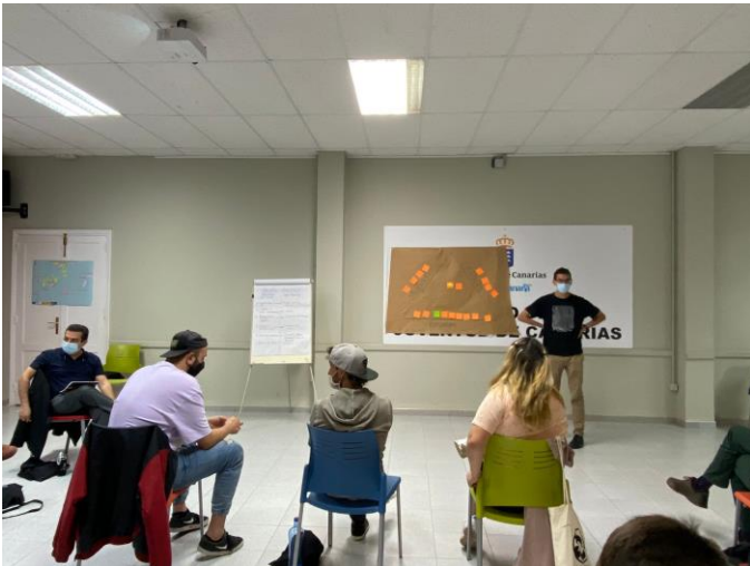
Foto 3: Debate sobre las relaciones existentes y posibles entre las asociaciones y entidades presentes.

Tras esta presentación se hizo un descanso y a continuación, se desarrolló la dinámica del sociograma a través de la cual se pretendía conocer de manera gráfica el grado de relación entre los asistentes y, en un siguiente paso, entre las entidades relevantes en materia de juventud en general.