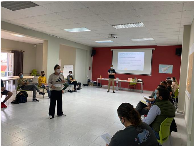
Foto 1: Presentación de una de las entidades presentes al encuentro ante el resto de asistentes.

Esta jornada presencial fue la sexta de una serie de 25 encuentros, la primera de las dos que se realizaron en el archipiélago para este ciclo, y se celebró en el Centro Atlántico de la Juventud, Tenerife.