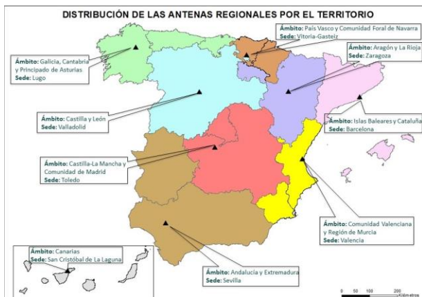
Mapa 1: Distribución del equipo de Antenas Regionales por el territorio.