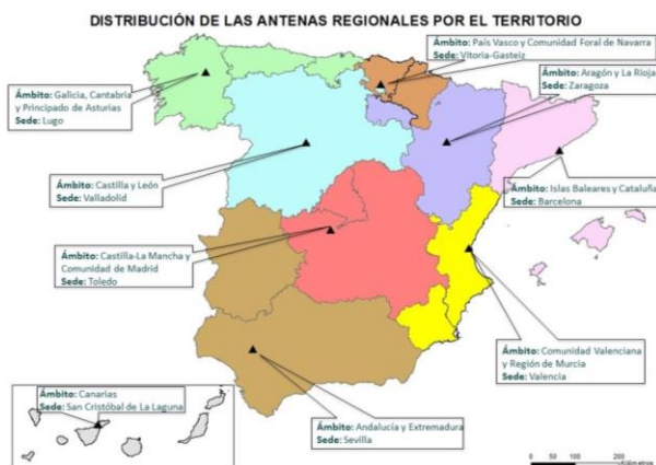
Mapa 1: Distribución del equipo de Antenas Regionales por el territorio.