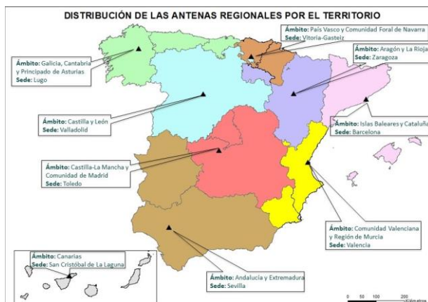
Mapa 1: Distribución del equipo de Antenas Regionales por el territorio.