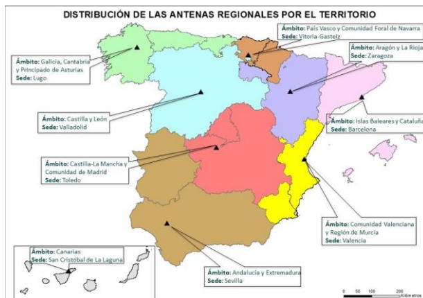
Mapa 1: Distribución del equipo de Antenas Regionales por el territorio.