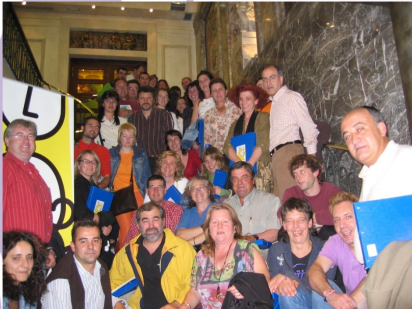
Jornadas de trabajo sobre Igualdad en el sindicato agrario COAG.

NUESTRO RETO ES POTENCIAR UNOS PUEBLOS CON MUJERES EN LA VIDA PÚBLICA, MÁS ALLÁ DE LOS ROLES QUE NOS ENCASILLAN EN LAS ASOCIACIONES DE PADRES Y MADRES, EN LAS ASOCIACIONES CULTURALES O RELIGIOSAS. MUJERES CON CAPACIDAD DE DECISIÓN Y CON AUTOESTIMA PARA CREERSE CAPACES DE HACERLO.