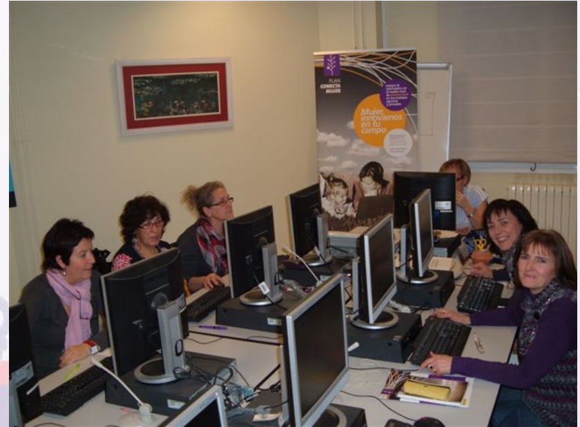
Uso nuevas tecnologías para empresas de mujeres. Plan Conecta.