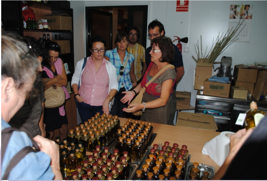
Curso de transformación de alimentos. Diversificación de la explotación agraria.