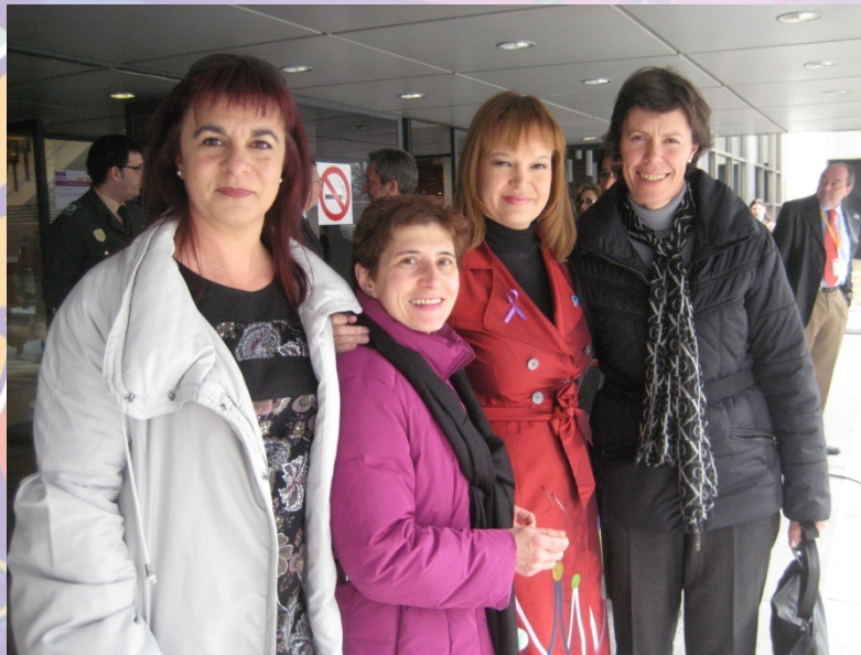
Día de la Mujer 2011 con la Ministra de Igualdad, Leire Pajín.

Aportamos el ENFOQUE DE LA MUJER RURAL a todas las estadísticas y documentos donde podemos introducir nuestra participación partiendo de la información de lo local.